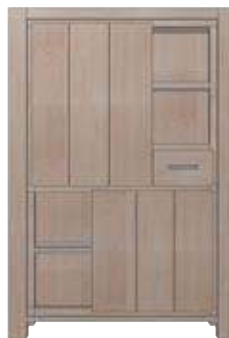
Art. 27577 160x110x42