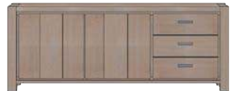
Art. 27575 85x220x42