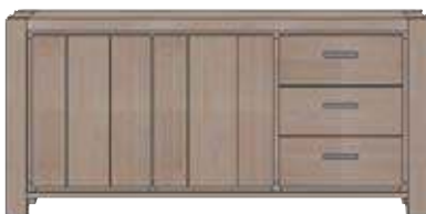
Art. 27576 85x180x42